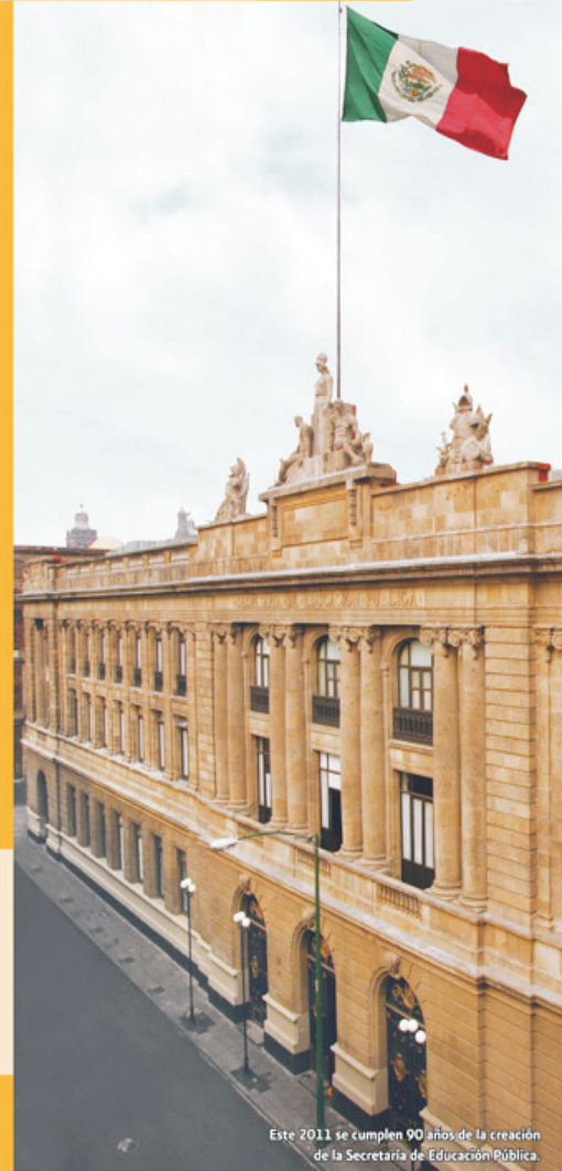
Este 2011 se cumplen 90 años de la creación de la Secretaría de Educación Pública.